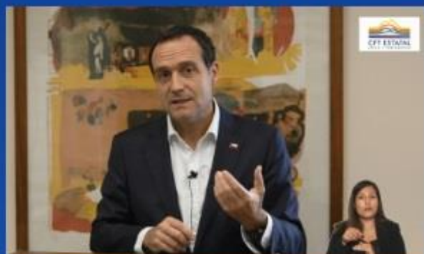
El saludo del Subsecretario de Educación Superior.