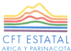
TABLA DE CONVALIDACIÓN