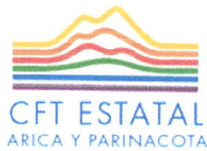
TABLA DE CONVALIDACIÓN