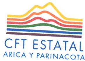
TABLA DE CONVALIDACIÓN