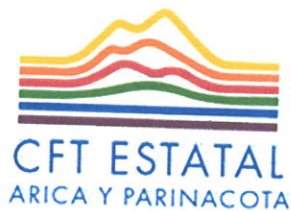
TABLA DE CONVALIDACIÓN