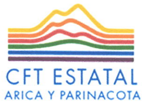
TABLA DE CONVALIDACIÓN